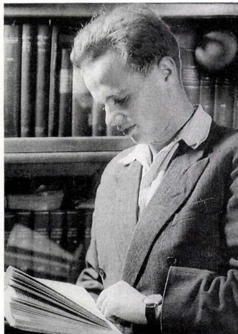
A régi szép időkben...

– Úgy van. November 5-én megindult volna a munka. Azok, akik valóban forradalmat csináltak, maguk vállalták, hogy az ellenőrizhetetlen, szélsőjobbaldali anarchisztikus kalandor jellegű csoportok ellen akcióba lépnek, ha ez szükséges. Úgy látszott, a kormánynak kellő karhatalma volt már, és akkor jött a beavatkozás.